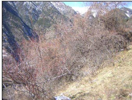
Bartra: barsigal amb gavarneres i arços