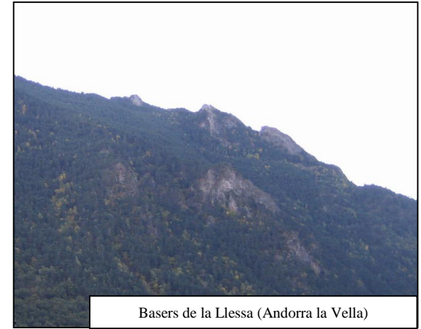
Basers de la Llessa (Andorra la Vella)