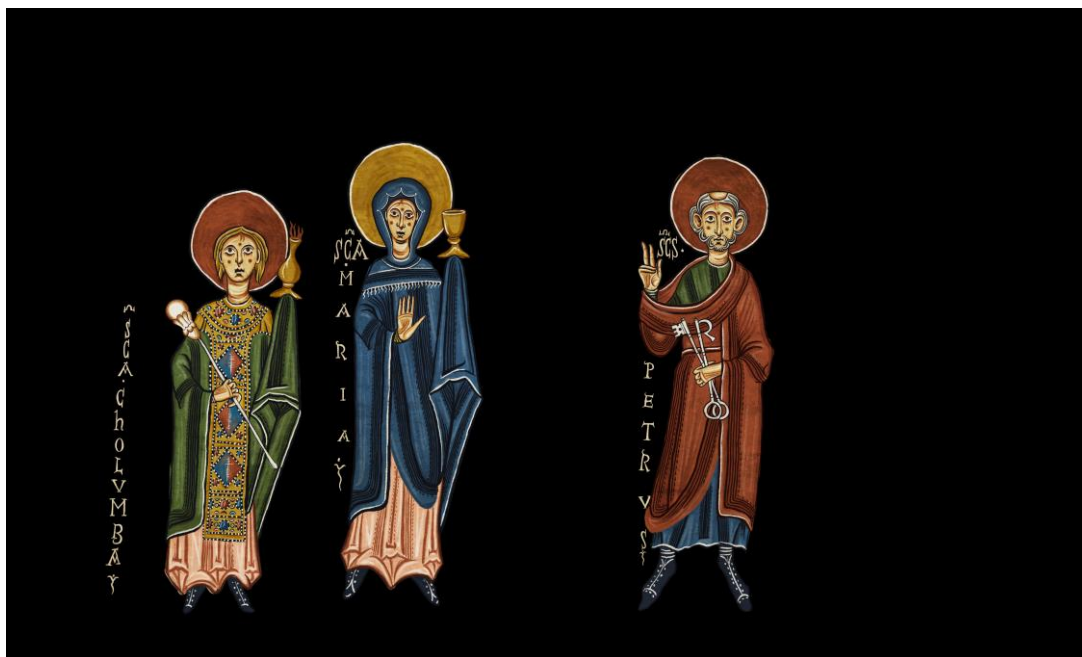
Detall del videomapatge de l'església de Santa Coloma.

La pintura mural és la protagonista indiscutible d'aquests monuments. Està ubicada generalment a la conca absidal, abraçant l'altar, el lloc més adient per representar-hi imatges teofàniques. A grans trets, el discurs pictòric s'organitza amb el Crist o la Verge, ubicats al quart d'esfera dels absis, i tota mena de figures complementàries.