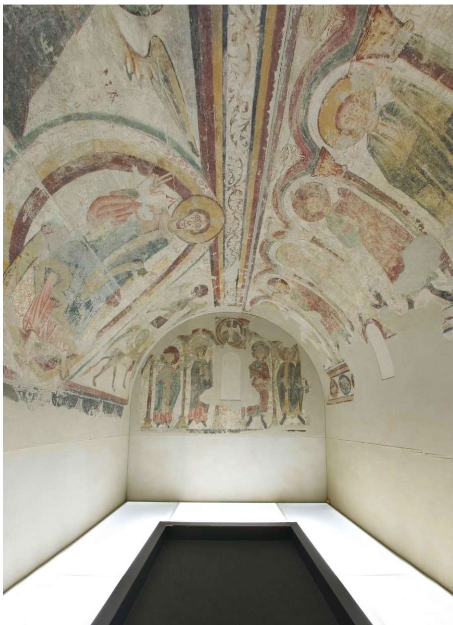
Muntatge de les pintures murals originals de Santa Coloma .

La seva visita és complementària de la de l'església de Santa Coloma, l'exemple més representatiu de l'arquitectura del moment i antic contenidor de les pintures murals arrencades als anys trenta. A l'església s'hi ofereix una projecció en sistema de videomapatge que permet veure i viure una experiència que transporta el visitant a l'interior original de l'església mostrant-li el seu aspecte aproximat al segle XII.