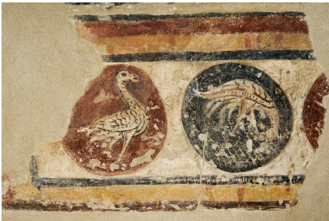
Detall d'una sanefa de les pintures murals originals de Santa Coloma.

Els artistes són artífexs que treballen en tallers , equips de treballadors de l'art, dedicats de manera més o menys especialitzada a un determinat procediment tècnic. La denominació de mestre no l'hem d'entendre com un únic personatge sinó com una "manera de fer" compartida per artífexs diversos.