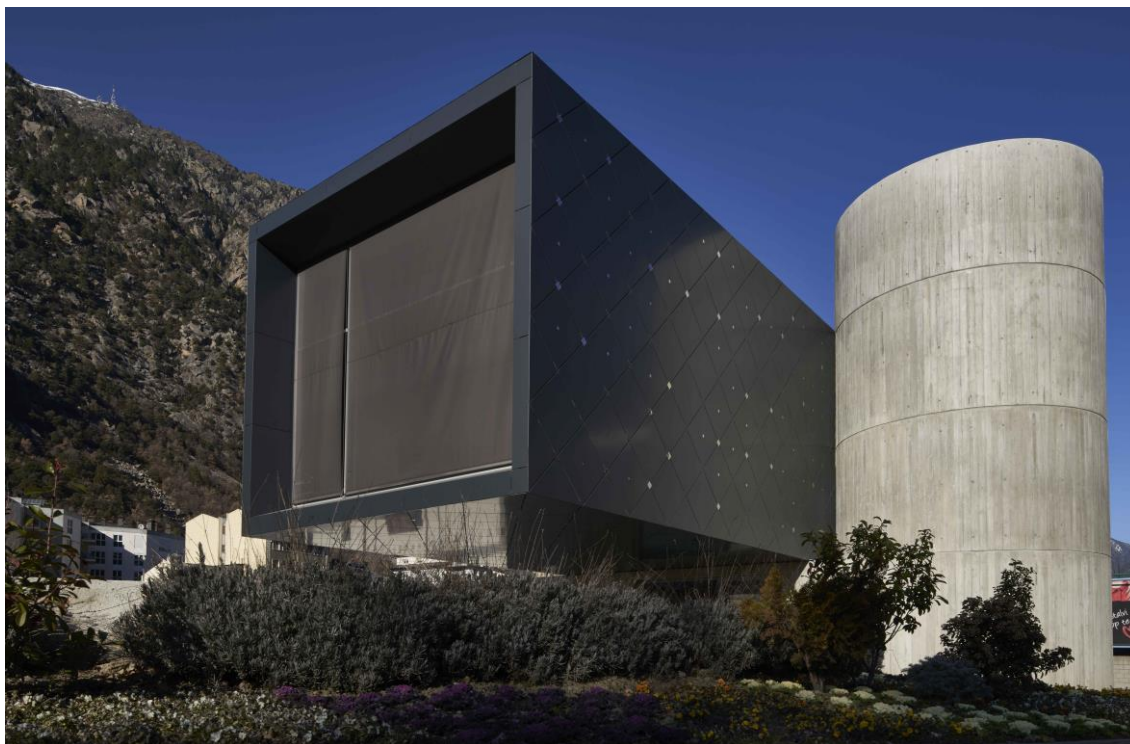
L'equipament museístic Espai Columba.

L'Espai Columba és un equipament cultural que té com a missió custodiar, conservar i presentar les pintures murals de l'absis de l'església de Santa Coloma i diversos objectes litúrgics provinents de les esglésies andorranes. Es tracta d'un centre difusor del coneixement de la pintura romànica a Andorra, sense oblidar el seu context arquitectònic i les altres manifestacions artístiques que formaven part de l'univers diví d'aquest estil artístic.