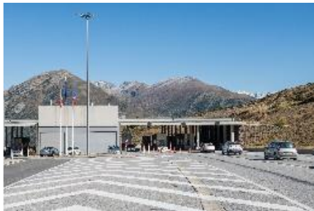
Frontera Franco Andorrana